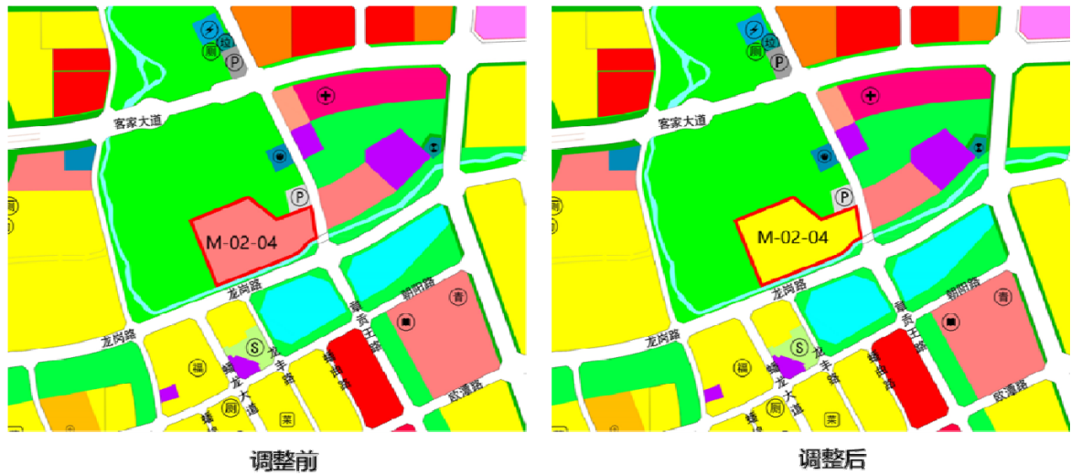
M-02-04 地块调整前后示意图