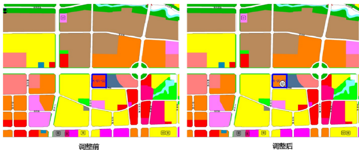
K-01-02 地块调整前后示意图

K-01-02 地块用地面积 3.93 公顷维持不变，用地性质由娱乐康体用地调整为商住用地，容积率由 \leq 3.5 调整为 \leq 1.8 ，建筑密度由 \leq 40\% 调整为 \leq 30\% ，绿地率由 \geq 20\% 调整为 \geq 30\% ，建筑高度由 100 米调整为 54 米，停车位由 0.8 个/100 m^2 调整为 1.0 个/户。K-01-02、K-02-01 地块共同在 K-01-02 地块配建 9 班托儿所和幼儿园，其中托位按照每千人口不少于 10 个托位进行设置。