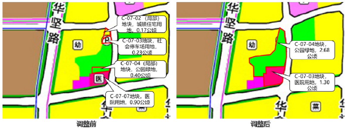
C-07-04 (局部) 地块调整示意图